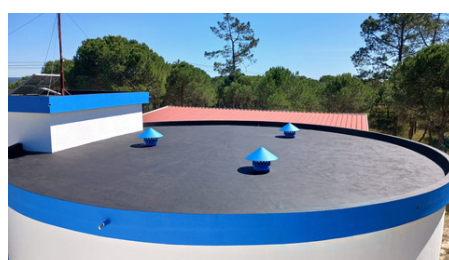
Reservatório da Mata