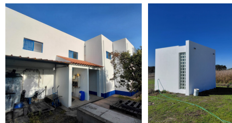
ETA da Rabaça e ETAR de Aldeia dos Fernandes