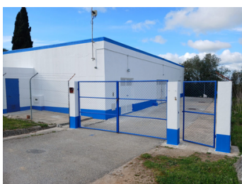
Reservatório de Visitação e Filtro vertical do Escoural.