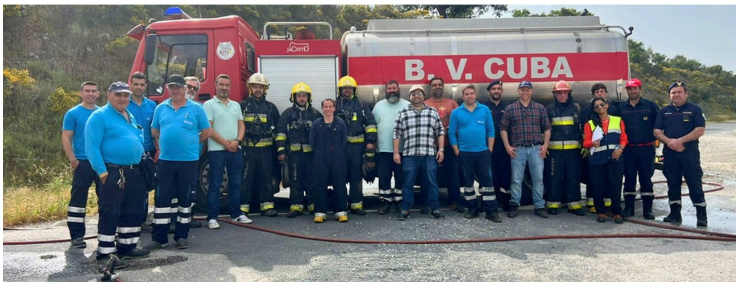
Simulacro reforça preparação para situações de emergência na ETA do Alvito. (Pág. 2)