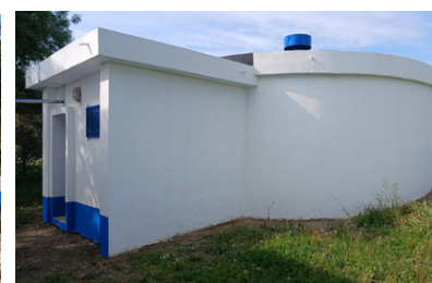
Reservatório de Santa Susana