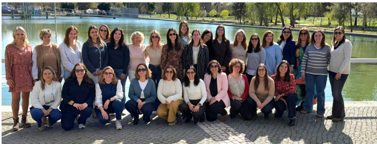
Dia Internacional da Mulher - Almoço de Comemoração do Dia Internacional da Mulher na AgdA (Pág. 2)