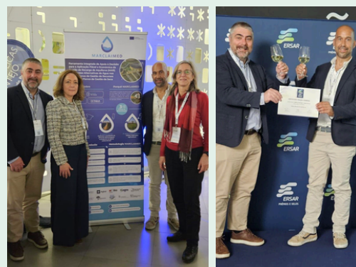
Saiba mais acerca do Projeto MARCLAIMED

Ao todo, foram submetidas 28 candidaturas, avaliadas por um júri composto por especialistas de diversas áreas, com o Projeto MARCLAIMED a ficar selecionado entre os 3 melhores!