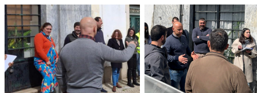
Simulacros de evacuação promovidos pelo DSE.