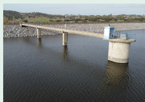
Barragem do Enxoé (Serpa)

O contrato, adjudicado à empresa H Tecnic – Construções Lda, tem um valor aproximado de 1,5 milhões de euros e um prazo de execução de 270 dias. Saiba mais