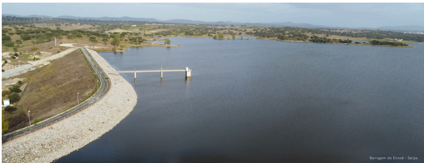
Barragem do Enxoé - Serpa

Adjudicada a Empreitada de Reabilitação da Barragem do Enxoé e da Barragem de Monte Clérigo. (Pág. 3)