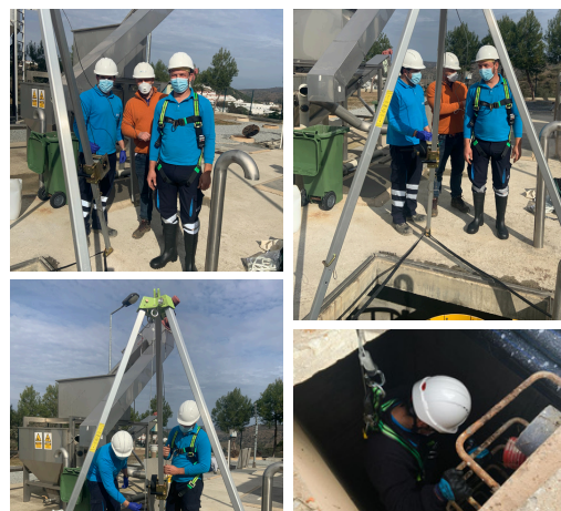
Apoio a colegas da Operação e Manutenção numa entrada em espaço confinado.